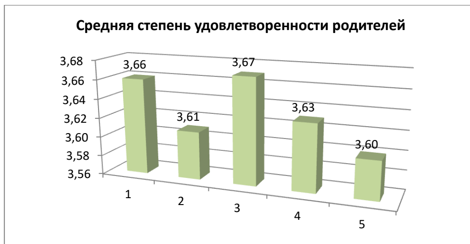
Диаграмма 1 «Средняя степень удовлетворенности родителей»

Графическое представление полученных данных можно увидеть на диаграмме 1.